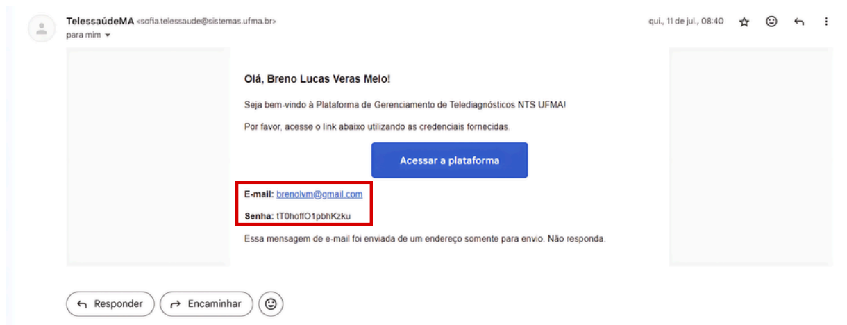
Figura 1. SEQ Figura \* ARABIC 1- Representação do e-mail de boas-vindas e credenciais de acesso ao SGTD.