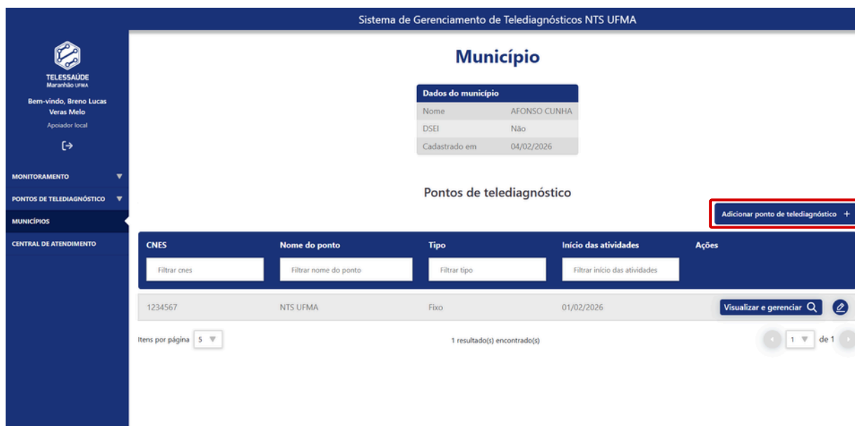
Figura 2. SEQ Figura \* ARABIC 2 - Figura 2 - Interface principal do SGTD com destaque para o comando de adição de pontos.